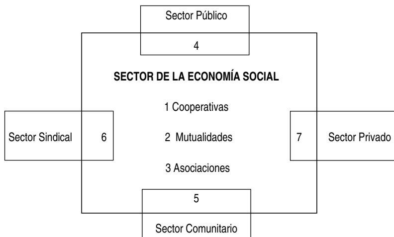
Figura 1. Fronteras de la Economía Social

realiza en colaboración con una asociación local o una comunidad de barrio. El sector sindical considera en el margen a la entidad paritaria donde el sindicato participa como agente garante de la gestión. Finalmente, la frontera del sector privado donde se sitúa la entidad participativa, en la cual los trabajadores participan en la propiedad, gestión y distribución de resultados, es similar a las sociedades cooperativas.