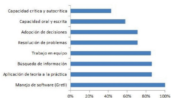
Figura 2: Valoración de los estudiantes de las competencias de Econometría.

yendo –además del Manual de usuario – una guía denominada Manos a la obra , un foro específico sobre Gretl y una sección FAQ (Frequently Asked Questions).