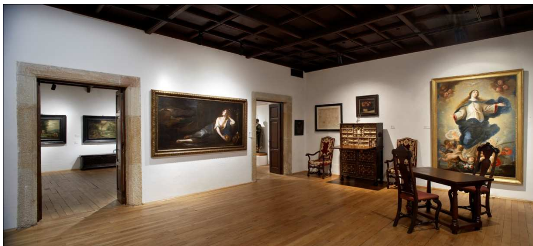
Fig. 5. Vista interior de las salas dedicadas a Jovellanos.

la donación del pintor Ángel García Carrió 34 , además de treinta fotografías de la desaparecida Colección de Bocetos de Jovellanos y algunas antigüedades arqueológicas y mobiliarias 35 (de las que una parte estaba vinculada a la casa. Había, de este modo, una mezcla de objetos que recordaban la figura de Jovellanos y bosquejaban aún de un modo muy parcial la evolución de la pintura asturiana 36 . La estructura de la recreada vivienda de Jovellanos condicionaba el museo, en realidad, una colección de colecciones 37 .