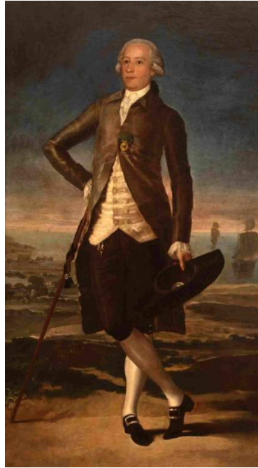
Fig. 1. Retrato de Jovellanos por Francisco de Goya y Lucientes, c. 1783. Propiedad: Depósito del Estado por dación en pago de Hidroeléctrica del Cantábrico en el Museo de Bellas Artes de Asturias, Oviedo. Col. Museo Nacional de Escultura (Valladolid).

Para adquirir la pintura de Goya se empleó de nuevo la fórmula de la dación, pero esta vez en concepto de liquidación del Impuesto de Sociedades, merced a un acuerdo con la firma asturiana Hidroeléctrica del Cantábrico que abonó los quinientos millones de pesetas apercibidos pasando así la pintura a manos del Estado Español, que la vinculó al mismo museo vallisoletano y la ingresó en el centro ovetense como depósito indefinido en el mes de abril de 2000 4 .