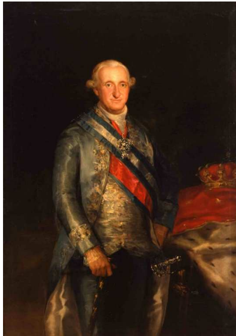
Fig. 2. Retrato de Carlos IV por Francisco de Goya y Lucientes, 1789. Propiedad: Colección Pedro Masaveu. Depósito del Principado de Asturias en el Museo de Bellas Artes de Asturias, Oviedo.

resto del nutrido lote de la dación Masaveu. Tras su estudio se concluyó que incluso se puede tratar del prototipo fijado por el pintor para definir la imagen del rey en 1789 y, en la actualidad está unánimemente aceptada su inclusión en el catálogo de obras del artista.