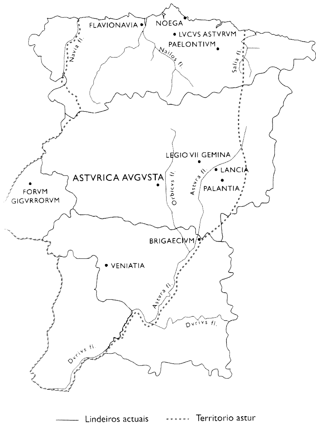
MAPA I. Primitivo territorio astur, segundo Carmen Fernández Ochoa