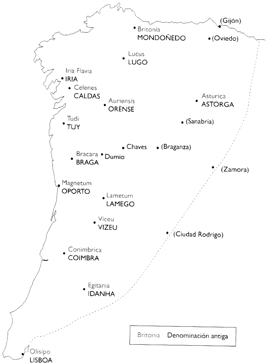
MAPA 2. Dióceses suevas (420-572), segundo Camilo Torres.