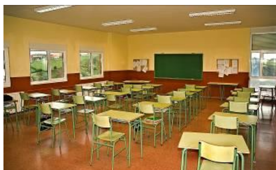
Figura3: Aula ordinaria del IES de Candás.