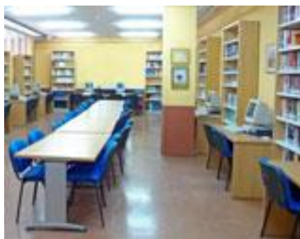
Figura2: Biblioteca del IES de Candás.

distribuidos por todas sus plantas, rampas de acceso al edificio, cafetería y un vestuario para el personal no docente.