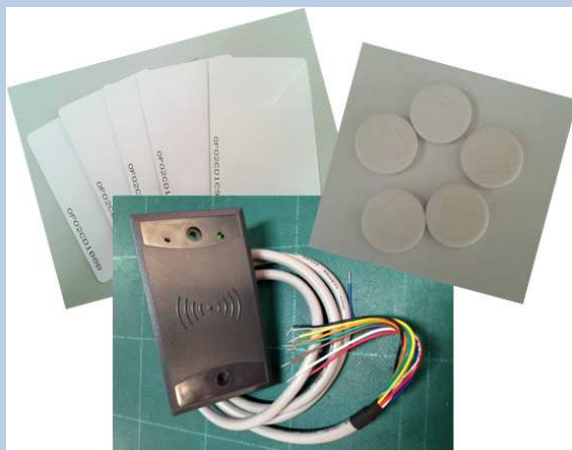
Componentes Tecnología RFID