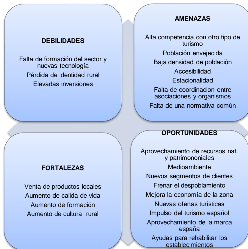
CUADRO 7. DAFO