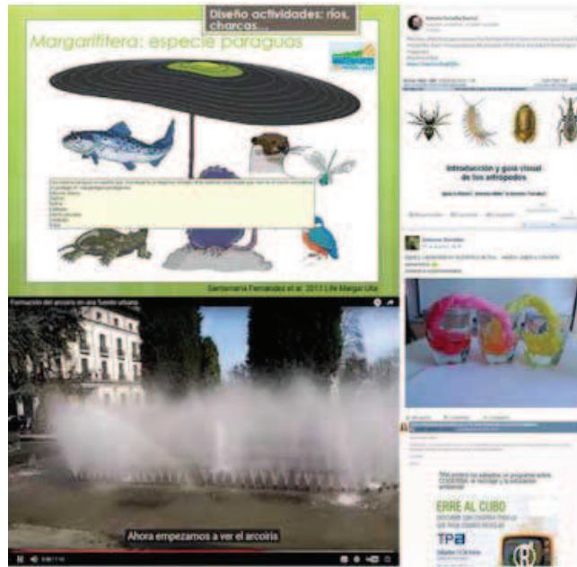
Figura 1. Ejemplos de recursos infoaccesibles creados sobre Ciencias de la Vida (archivos pdf infoaccesibles de las presentaciones, vídeos cortos con subtítulos explicativos integrados, comunicación de recursos didácticos y experiencias de laboratorio a través de las redes sociales y de los foros del Campus Virtual) y cómo son utilizados en las tres asignaturas de formación inicial de maestros en el curso 2016/2017.