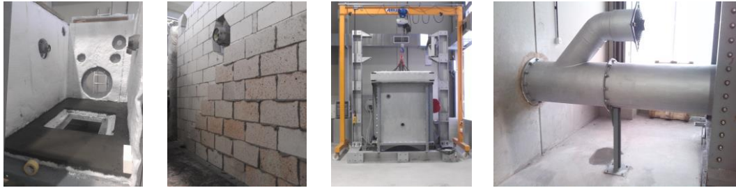
Figura 2. Montaje del horno de ensayo: (a) Capa de aislamiento con lana cerámica; (b) Detalle de acabado interior con ladrillo cerámico; (c) Vista frontal; (d) Vista posterior con salida de humos.