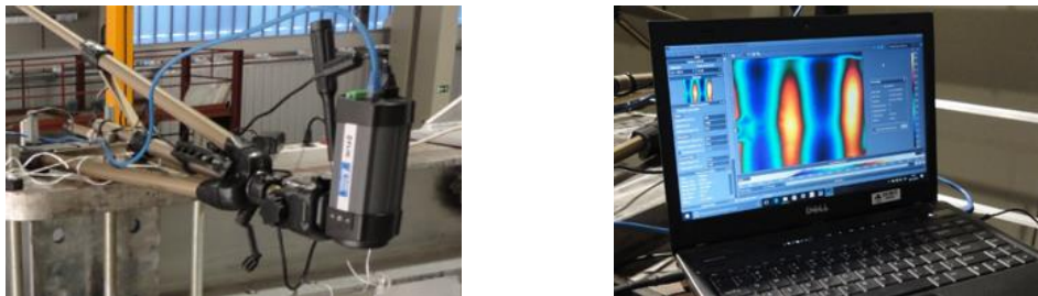
Figura 5. Detalle de la cámara termográfica empleada (izquierda) y visualización de la imagen térmica captada (derecha).

Para conocer la variación de temperaturas en la superficie no expuesta de la losa ensayada se ha utilizado una cámara termográfica (0) que enfoca una sección transversal de la losa ensayada. En estas imágenes se muestra la influencia del espesor de hormigón en cada zona.