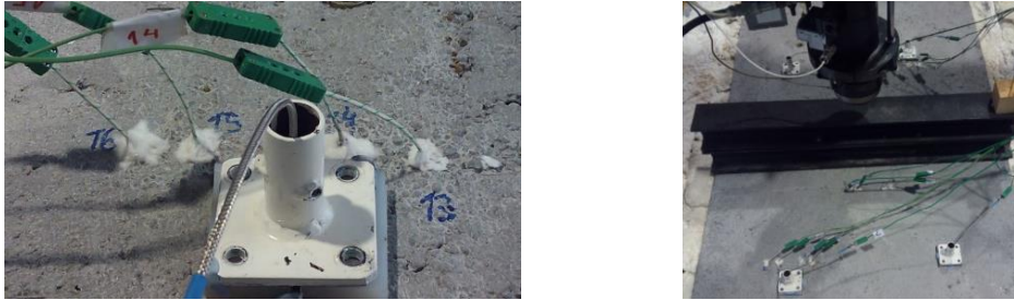
Figura 4. Sensores de temperatura (izquierda) y aplicación y distribución de la carga (derecha).

La carga sobre las losas se aplica mediante un actuador sobre una viga transversal que permite el reparto uniforme de la carga (0).