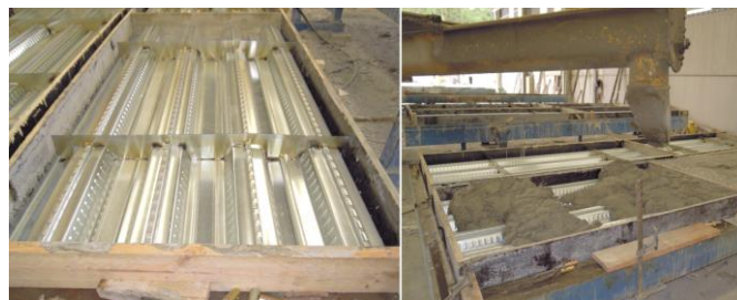
Figura 3. Detalle de la chapa de acero utilizada (izquierda) y fabricación de las losas mixtas (derecha).