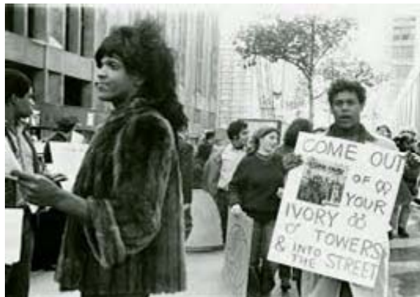
Disturbios de Stonewall, Nueva York. 1969

Identidad de género: Hace referencia a la identificación con el sexo asignado al nacer.:Si = CIS, No = Trans.