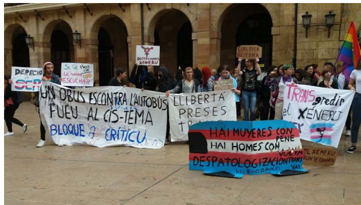
Concentración Xega contra el bus de Hazte oír