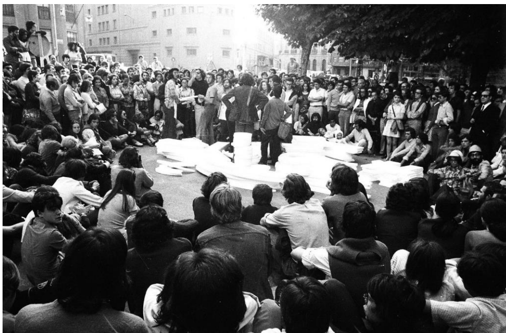
Fig. 3. Encuentros de Pamplona , Foto Eduardo Momeñe.