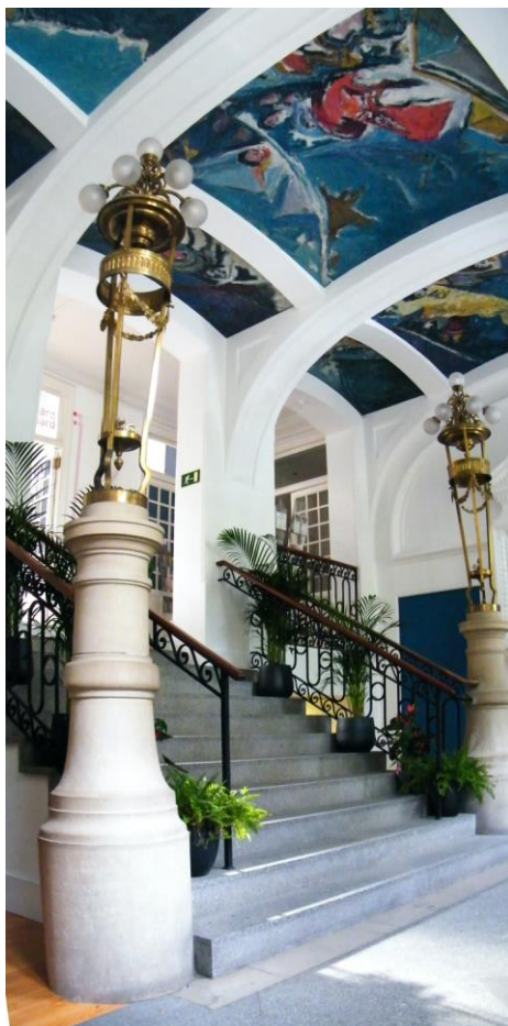
Fig.1. Instituto Francés de Madrid , Wikimedia Commons.