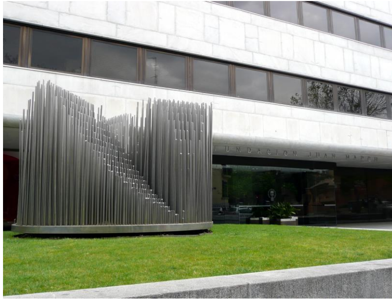
Fig. 5. Sede de la Fundación Juan March , Madrid