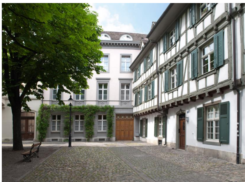
Fig. 4. Paul Sacher Stiftung , Basilea, Wikimedia Commons