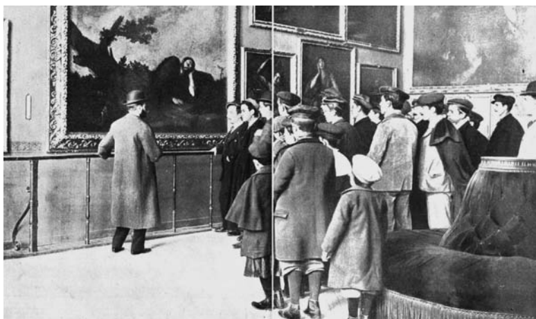
Fig. 1. Lección en el Museo del Prado, 1905.