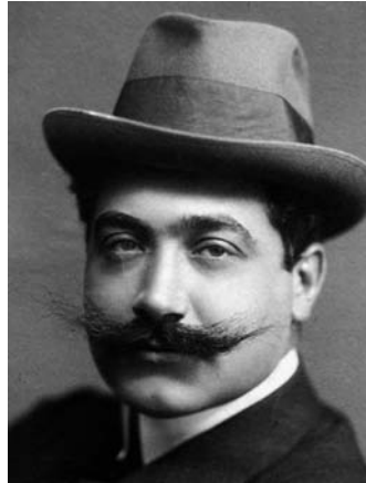
Fig. 3. Miguel Salvador ( Por esos mundos , 1910).

de Richard Strauss en el Teatro Real, conferencia que, suponemos, debió ser una adaptación de la pronunciada días antes en el Ateneo de Madrid 105 . Además de lo expuesto, en el descenso específico de la actividad musical de la UPM creemos que influyeron otras dos causas: el cambio de estrategia, ahora más enfocada hacia los cursos sistemáticos y, también, que su presidente, Miguel Salvador, en la primavera de 1910 debió estar completamente absorto por las elecciones al Ateneo de Madrid, donde llegó a ocupar el cargo de vicepresidente de la Sección de música 106 y, sobre todo, por la campaña electoral que culminó con su elección como diputado del Partido Liberal al Congreso por el distrito de Vera (Almería), a principios de mayo 107 . Una breve biografía sobre su persona, que venía acompañada del retrato que se adjunta (Fig. 3), hacía notar lo siguiente: «Su obra de mayor trascendencia es la Universidad Popular, en nombre de la cual da sus explicaciones todos los sábados en la Casa del Pueblo y en la que ha sabido conservar la neutralidad hasta el punto de extender su acción a los centros más diversos, desde los católicos y patronales a los republicanos y socialistas» 108 .