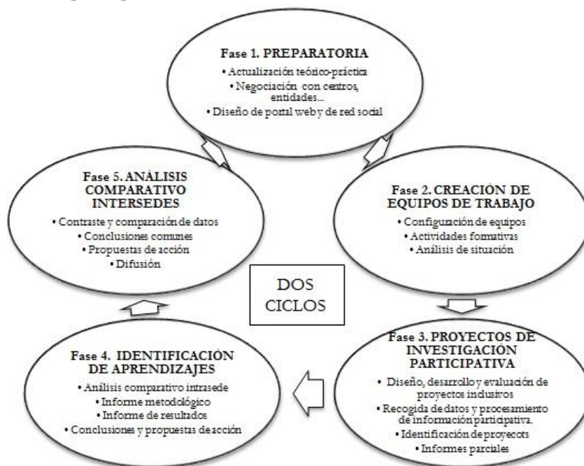
Gráfico 1. Fases comunes a todos los subproyectos

El proyecto de investigación coordinado se articula en torno a 5 fases comunes a los cuatro subproyectos, que garantizan la cohesión y coherencia entre ellos a lo largo de los cuatro años de duración, al mismo tiempo se respeta la singularidad propia de cada uno, dada la diversidad de temáticas y que la metodología participativa no permiten unificar el desarrollo de proyectos que son gestionados por los diferentes participantes de cada comunidad. Dichas 5 fases son: