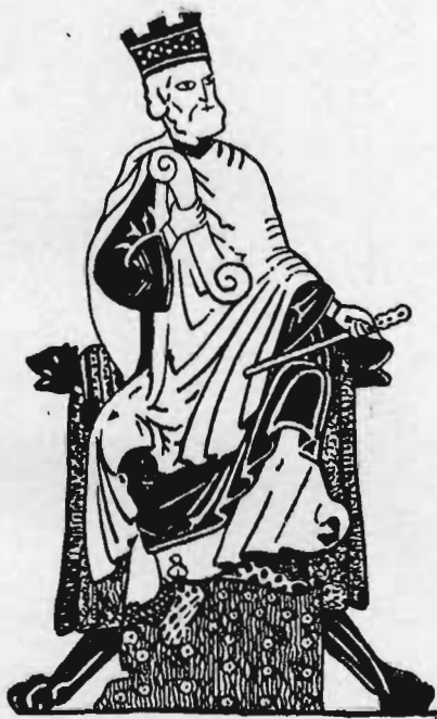
EL REY D. ALFONSO VI (Tumbo de Santiago)