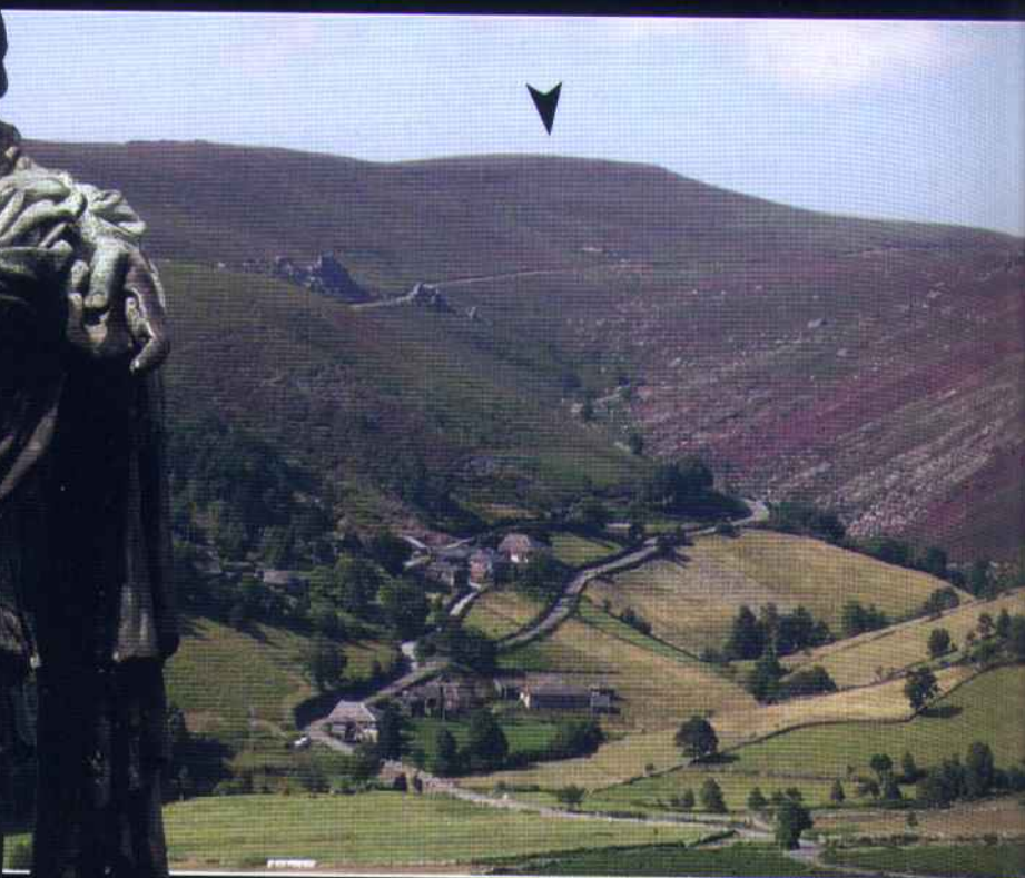
Vista xeneral del monte de Moyapán, dende La Llagrada, al sur, col pueblu d'El Rebolu en primer planu

1 davidviso@hotmail.com 2 pesicu@gmail.com