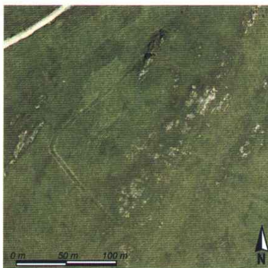
Vista aérea del recintu campamental, obtenida del visor on-line del SigPac [ http://sigpac.mapa.es/feqa/visor/ ]

El campamentu de Moyapán queda definíu fundamentalmente polas sús llindes, yá que l'interior del recintu nun amuesa rastru nengunu d'evidencias estructurales asociables cola ocupación del sitiu.