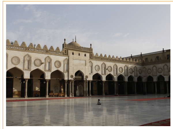
Figura 3. Mezquita de al-Azhar, El Cairo.

la vida de médicos judíos que habían practicado su arte en el mundo árabe en el Medioevo.