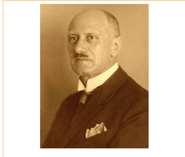
Figura 1. Max Meyerhof.

Durante sus estudios de posgrado en Oftalmología recibió recordatorios constantes de que Egipto era un lugar importante para el estudio de las enfermedades