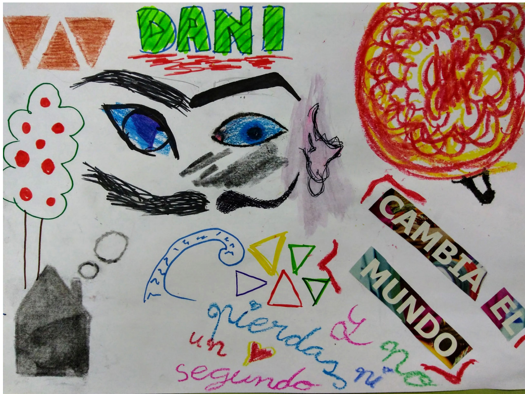
Figura 2. Ejercicio realizado por el alumnado.

En esta actividad (Fig. 2), tanto las imágenes como los textos confirman que el alumnado asocia la materia con creatividad y la imaginación, pero también la persistencia de ideas preconcebidas como la asociación de esta con el entretenimiento, la idea clásica del pintor con la paleta y las manualidades.