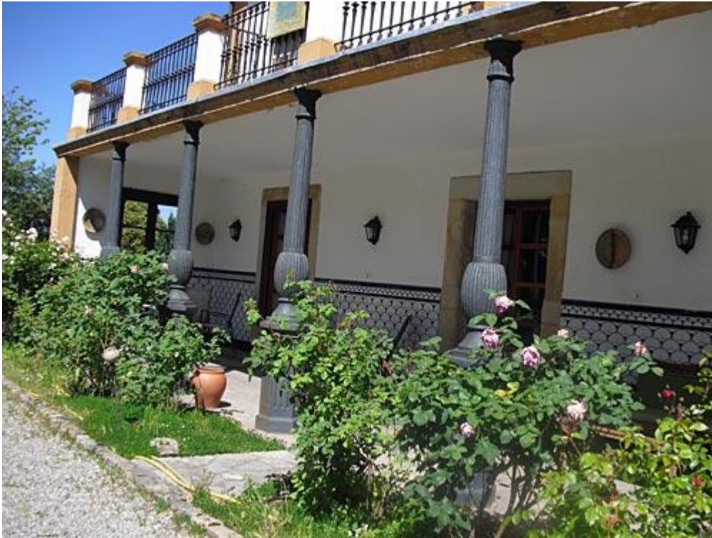
Ilustración 05. Hotel Quinta Duro. Lugar de recreo de la familia Duro. Gijón.