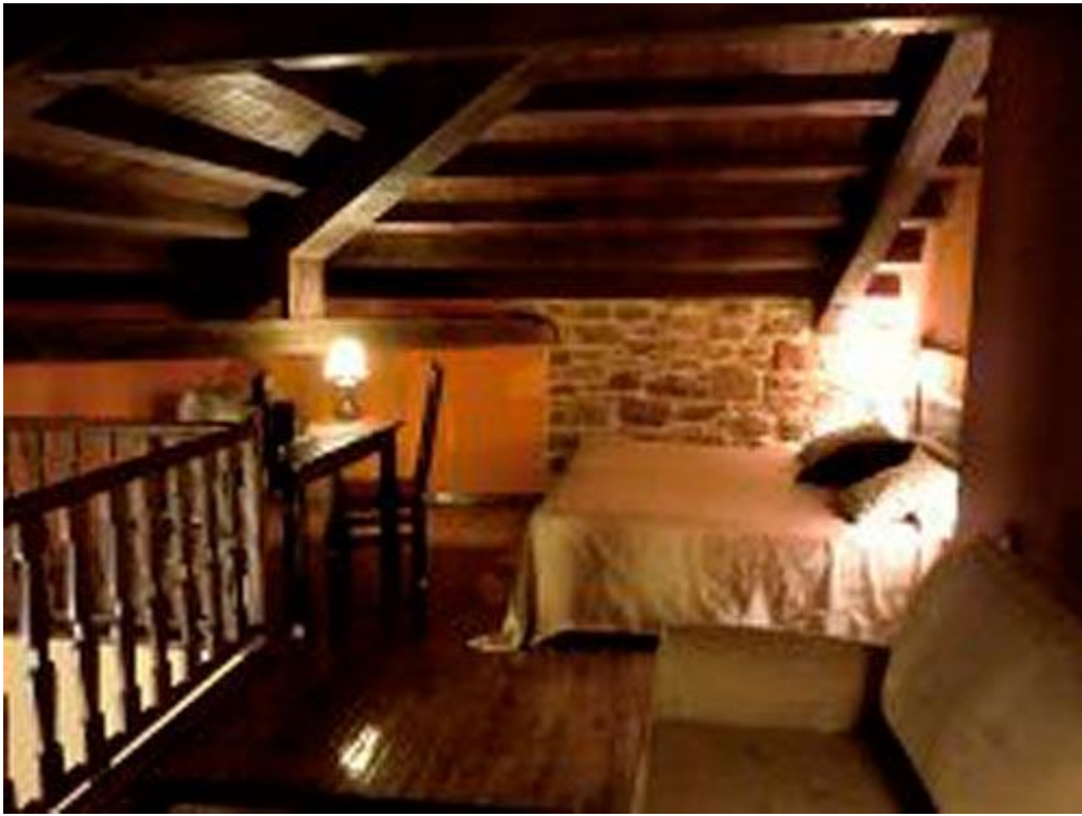
Ilustración 04. La Corte de Lugás. Interior.

permitiese la introducción de cambios y modificaciones en la distribución, si fuese necesario, de una forma rápida y sencilla”. Se tienen en cuenta como imprescindibles, aunque no siempre frecuentes, criterios de sostenibilidad. [Ilustración 04]