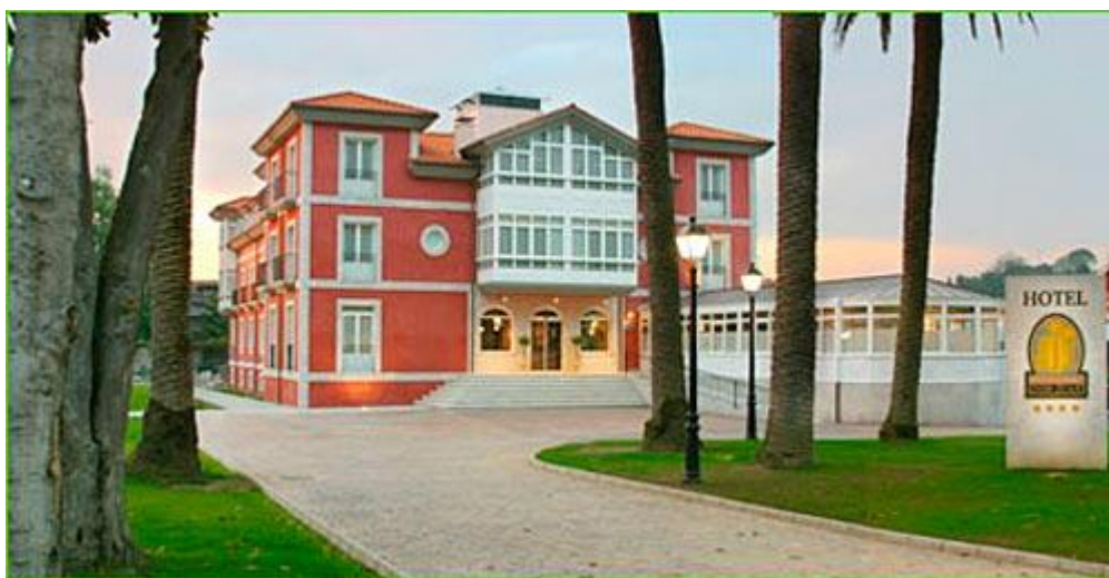
Ilustración 02. La Hacienda de Don Juan (2002). Llanes.