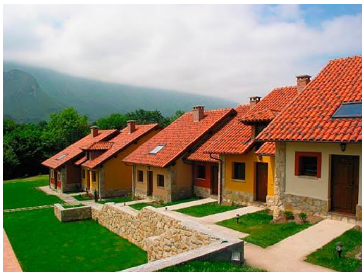
Ilustración 01. La Llúriga (2002). Arquitecto Ricardo Peláez Amieva Ortiz. (Llanes).

El mismo planteamiento de corrada o corralada aparece en La Llúriga (2002), obra del arquitecto Ricardo Peláez Amieva, autor de numerosas construcciones para el turismo rural 4 . El complejo que se ubica en la localidad de Ortiz (Llanes), se estructura en dos bloques paralelos integrados cada uno por seis pequeños volúmenes adosados, pintados en tonos ocres y tierras y con zócalo de piedra. En el centro se ubica la piscina y cerrando otro de los lados el edificio principal, que reinterpreta modelos de casonas con alusiones a la arquitectura local, con los amplios aleros y los cortafuegos pétreos. También piedra se utiliza para enmarcar los vanos, lográndose en general un sabor popular que refuerzan las cubiertas de madera. [Ilustración 01]