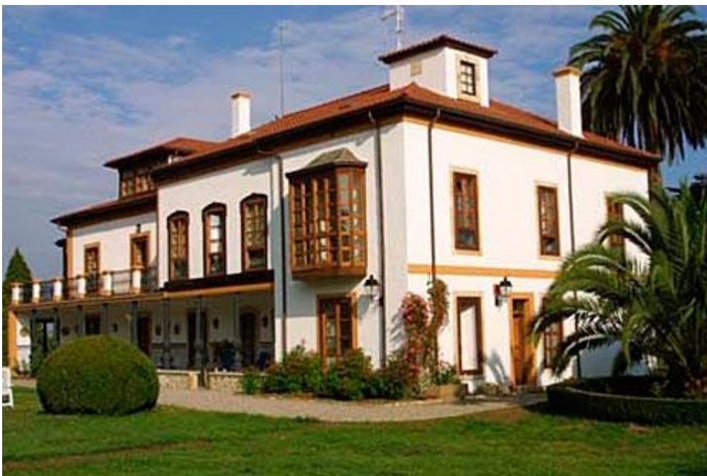
Ilustración 06. Hotel Quinta Duro. Fachada sureste.

En el exterior, la pérgola de hierro dulce, que oxida sin deteriorar, da idea del profundo conocimiento de los metales. Se conserva tal cual, maleable y resistente, oxidada y bella, sin haber estado nunca pintada. [Ilustración 06]