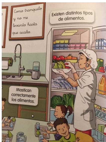
Fig. 1. Representación mujer cocinera.

VV.AA. (2011). Conocimiento del medio 2 Primaria . Tres Cantos: Santillana.