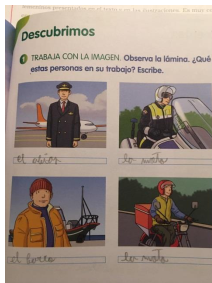
Fig.2. Representación de trabajos desempeñados por el hombre.