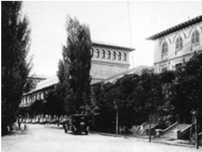
Ilustración 8: Residencia de estudiantes en 1928, fecha en que la visitan Ravel y Le Corbusier, entre otros artistas.