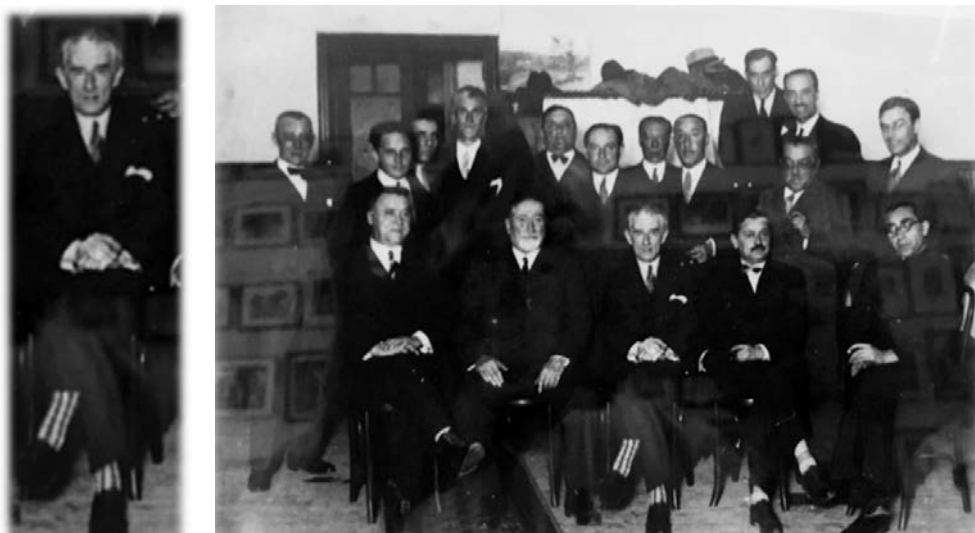
Ilustraciones 9 y 10. Maurice Ravel en Oviedo, tras su concierto en la Sociedad Filarmónica, con sus llamativos calcetines.

También el público ovetense, a decir por algunas de las crónicas que hemos podido leer, se dejó llevar por las apariencias, las formas... o algo mucho más peregrino y poco importante: los calcetines de Ravel (véase la ilustración 9). Pero esto es algo anecdótico, que nos ha servido para adornar el título de esta comunicación. Preferimos citarlo simplemente y ascender más allá de las rodillas para continuar con esta mirada a nuestro admirado compositor.