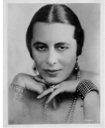
Ilustración 7. La mezzosoprano francesa Madaleine Grey.