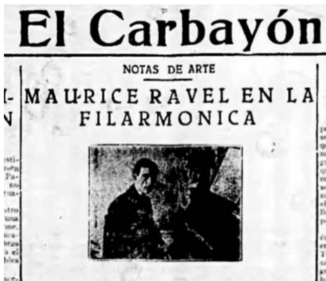
Ilustración 12: Anuncio del concierto de Ravel en la Filarmónica, con foto incluida, en la primera página de El Carbayón.

La visita de Ravel a nuestra Sociedad de cultura ha producido merecida expectación y dejará imperecedero recuerdo entre los aficionados ovetenses, porque, muerto Debussy, es Ravel la figura culminante en la música francesa contemporánea y si sus producciones, originales y llenas de vida, pudieron ser, años atrás, muy discutidas, y hasta tildadas de extravagantes –como siempre ocurrió con la obra del genio, que se adelanta a su tiempo-, son recibidas hoy con ovaciones clamorosas, figurando constantemente en los programas de conciertos de los principales centros musicales del mundo 28 .