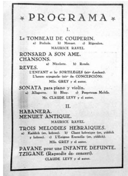
Ilustraciones 5 y 6. Maurice Ravel en Málaga, con el programa que interpretó con Lévy y Grey.

su idiosincrasia, simultáneamente incapaz de retener su alma y de abrirse al futuro, siempre diletante 17 . En La Unión Mercantil del 22 de noviembre 1928, el mencionado crítico, luciendo 24 años de corta edad, comentaba, sin aludir en absoluto a la música, lo siguiente: