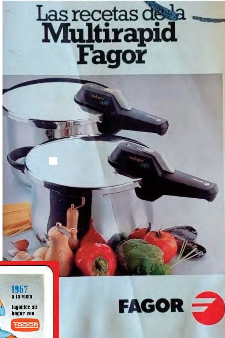
Olla Rapid Express Fagor