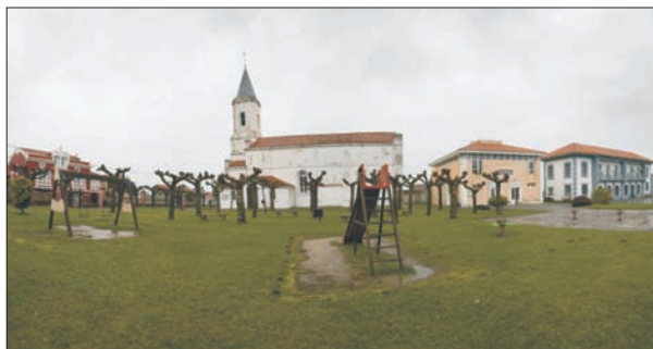
FIG. 11. El pueblo praviense de Somao, que asoma sobre el mar en la rasa comprendida entre los dos núcleos urbanos de Muros de Nalón y Cudillero es, sin lugar a dudas, un pueblo-jardín, pues afortunadamente se ha respetado el esponjamiento de las fincas con casa y «huertos de flor», como se decía antiguamente al jardín. Los indios provenientes de Pravia eligieron esta rasa elevada, con hermosas vistas al mar, para la ubicación de las casas hechas casi todas siguiendo catálogos de revistas francesas de casas de campo, a las que les adornaban con especies florales exóticas, provenientes de América, o no, tales como palmeras, araucarias, yucas, plataneras, castaños de indias, o ágaves, entre otras. Aunque en la imagen aparezcan los plátanos durante el invierno, estos arcos no son propios de la flora «indiana», pero los edificios civiles, que tampoco son de principio del siglo XX, sin embargo sí se han adaptado a la nobleza del resto de los edificios en los que las cercas casi no existen.

Al incremento de la superficie verde ayudó en igual o mayor medida la profusión de edificios con uso no residencial, acompañados por recintos vegetales generalmente no muy amplios que respondían a diferentes funciones. El grupo quizá más significativo fue el de los establecimientos de enseñanza, públicos como el Instituto Alfonso II, los colegios mayores universitarios (San Gregorio y Valdés Salas) y la Facultad de Ciencias de Oviedo, o propiedad de órdenes religiosas. El protagonismo de la Iglesia en el golpe de Estado contra la Segunda República, que desató la Guerra Civil, dio a esa institución un papel muy prominente durante la Dictadura. Su reflejo fue la multiplicación de los colegios católicos, por reforma y ampliación de los preexistentes o mediante obra nueva, sustentada a menudo en un gusto colosalista o monumental anacrónico. Entre las decenas de conventos y centros educativos podrían nombrarse el colegio San Fernando de Avilés, los Jesuitas de Gijón, las Ursulinas de Oviedo y las Dominicas en Sama de Langreo. Sus jardines o recintos arbolados varían, desde el simple claustro o el breve jardín-vestíbulo hasta la superficie boscosa envolvente, para dar idea de inmersión en la naturaleza. Éste era un rasgo diferenciador de los colegios que abandonaron el centro de las ciudades para buscar grandes fincas en zonas de calidad ambiental o en periferias residenciales exclusivas. La omnipresencia de la Iglesia tuvo otros exponentes como