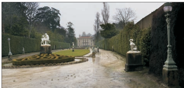
FIG. 6. En lo alto del pueblo pesquero de Cudillero, en el pago denominado El Pito, se encuentra el conjunto monumental de Los Selgas, presidido por un discreto palacio neoclásico encargado por Fortunato Selgas. El frente del edificio tiene unas escalinatas que sirven para entregarse al jardín francés ideado por el maestro Grandport; casi un siglo después de su construcción, la topiaria de las villas renacentistas toscanas interpretada y adaptada por André LeNotre para Versalles, aparece lustrosa en este jardín, adornado por estatuas, macizos florales, y fuentes que cumplen con los cánones impuestos por LeNotre. Detrás del palacio, se da un giro copernicano en la técnica jardinera, pues en torno a un lago, se dispone una gama amplia de árboles de distinta procedencia. El conjunto monumental se completa, rodeado por una magnífica valla metálica diáfana, con un grupo escolar de gran porte, donado al pueblo en 1915, una pequeña iglesia privada, una escultura de bronce en honor de los Selgas, y un pabellón que acoge una colección de tapices.

en evidencia que a menudo estuvieron conectadas con la creación o rectificación de concejos, y por tanto capitalidades. Mención aparte merece Trubia, por el significado de su plaza principal dentro de una fundación ex nihilo vinculada a la industria del Ramo de Guerra. Amén de aquellas plazas ajardinadas o al menos arboladas, en algunas cabeceras comarcales irían estableciéndose verdaderos parques (Pola de Siero, Salas), jardines como el de Pravia (lateral al palacio de Moutas y la Colegiata) y paseos marítimos como el de Llanes.