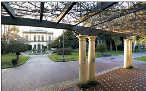
FIG. 10. Situado en la parte trasera de la Casa Consistorial de Villaviciosa, y sin tener mucha relación con la plaza del Huevo, que está en su parte delantera, el Parque Ballina se construyó merced a los aportes dinerarios de los emigrantes, retornados o no, que deseaban lo mejor para la villa. Su emplazamiento contribuyó a realzar más el edificio consistorial, de hermosa factura, y su diseño, muy elemental, tiene a las pérgolas que le adornan con plantas trepadoras, su característica más singular.

han pasado a mejor vida, pero aún pueden hallarse ejemplos interesantes como el manicomio de La Cadelada (Oviedo) y el hospital de Caridad (Avilés), por mencionar alguno. En las entidades menores su situación era más inmediata a núcleo, y con frecuencia al borde de la carretera general, por ejemplo las escuelas de Pola de Lena.