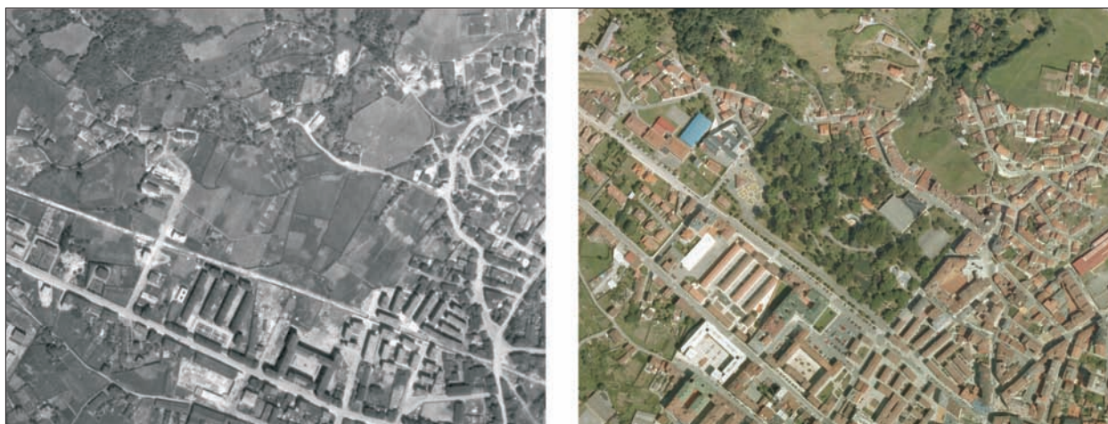
FIG. 17. Hasta 1976, el único parque de La Felguera era el denominado Dolores Duro, un coqueto rincón incrustado en el corazón de este distrito langreano. Pero el crecimiento de este núcleo, y las necesidades de espacio verde para una población cada vez más exigente, obligaron en los últimos años de mandato del Alcalde Antonio García Lago, a destinar como parque una pradería someramente rectangular situada cerca del pago de Respiño, ya en el borde urbano noroccidental felguerino. Por su corta historia, sus valores en jardinería no son muy notables, aunque una pequeña cancha deportiva y una jaula de aves le da cierta actividad. En cuanto empezó a prestar servicio, pasó a denominarse popularmente como Parque Nuevo (aunque su nombre oficial es el del alcalde que lo impulsó), de modo que el anterior también fue rebautizado como Parque Viejo. Escala aproximada 1:9.600.

cedentes de los años ochenta pero ampliados después. El ovetense de La Carisa (parque ciudad de Tampa), los de La Luz, Versalles y El Nudo en Avilés, o el parque de La Capilla entre Sotrongio y la barriada del Serrallo, tienen el mismo significado aunque algunos son posteriores. Como decíamos, el precoz deterioro de las barriadas de promoción pública (especialmente las de posguerra) obligó a la administración a profundizar y universalizar las mejoras urbanísticas introducidas desde los años ochenta, dándoles categoría de rehabilitación integral que en muchos casos se financia a fin de siglo con los fondos de reactivación para las cuencas mineras. En la actualidad la intervención ya alcanzó a la mayoría de los asentamientos de vivienda oficial, creando en ellos nuevos parques (como el de Emilio Murcia en Rioturbio-Mieres) o reformando los espacios libres preexistentes. En este caso se ganan pequeños jardines (Pola de Laviana, Pola de Lena, Mieres, Avilés), pero también pueden resultar parcialmente sustituidos por superficies de pavimento.