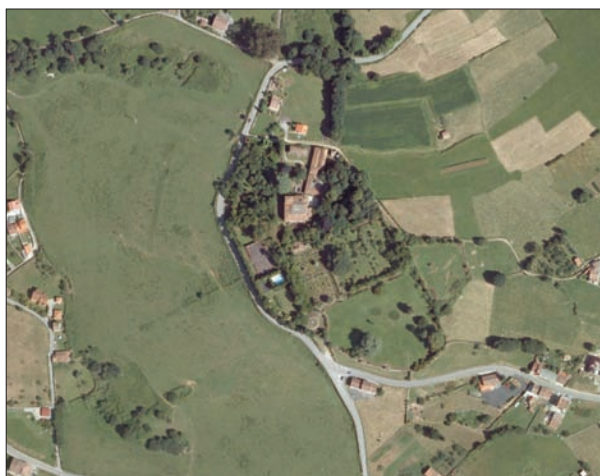
FIG. 5. Situada en la parroquia de Valdesoto, en las afueras de Pola de Siero, la finca que contiene el Palacio del Marqués de Canillejas o de Carreño-Solís, ocupa una extensión amurallada de siete hectáreas, en las que, además del palacio barroco pero muy puro de líneas, existe el mejor jardín histórico o clásico privado de toda Asturias. A modo de oasis de arquitectura y jardinería cultas entre las praderías del agro poleso, la finca amurallada tiene unos jardines extraordinarios, con todo tipo de elementos de adorno, como una pequeña capilla con una cúpula modernista, pabellón de recreo, cenador, parterres, invernaderos, plaza de azulejos esmaltados, jaulas de aves y fieras, palomar, balastradas, una torre sobre la valla, estatuas, y hasta un pequeño ingenio hidráulico para el riego en época de sequías. La bondad del jardín obedece al buen diseño de un maestro jardinero francés, que trabajó para el Palacio a finales del siglo XIX. Desde fuera de los altos muros que cercan la finca es difícil adivinar la hermosura de esta joya de la jardinería burguesa finidecimonónica. Escala aproximada 1:7.750.

Para aliviar la monotonía de los trazados regulares aplicados en la extensión urbana se intercalaron plazas, algunas tan significativas como las circulares o elípticas, que reflejan la atención concedida al factor movilidad. Las hay en Gijón (la de San Miguel, plaza-bisagra coincidente con una punta de estrella de la muralla), en