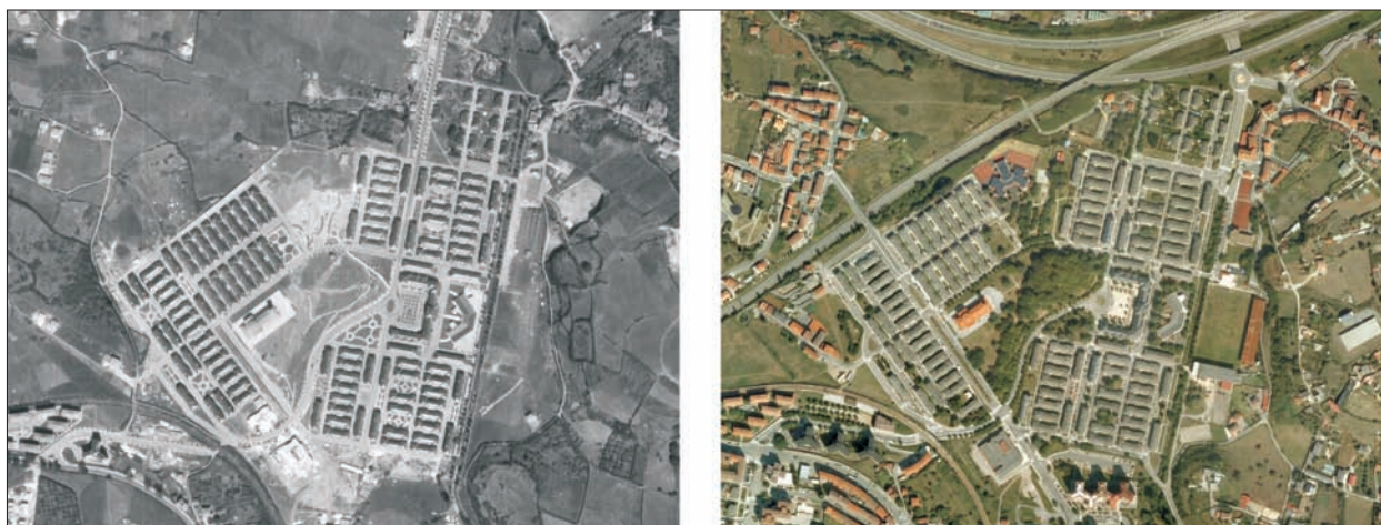
FIG. 15. A pesar de su carácter de «poblado» para alojar obreros cualificados de la Empresa Nacional Siderúrgica (ENSIDESA), el carácter paternalista que impregnaba este tipo de iniciativa franquista en 1951, Llaranes no deja de ser un buen ejemplo de «ciudad-jardín vertical», en la que unas dos mil personas que se asentaron en 1958 podían gozar de muchos más metros cuadrados de zona verde que los habitantes del «Avilés de siempre», de la que distaba dos kilómetros. Tiene la impronta del arquitecto Secundino Suazo, aunque no fuera el proyectista, y mantiene aún hoy la fisonomía de otras zonas urbanas levantadas al amparo del diseño urbanístico y arquitectónico de las Regiones Devastadas. Actualmente, el poblado de Llaranes está integrado en la malla urbana avilesina, como se aprecia en la segunda foto, aunque siga manteniendo el carácter de pueblo con todos los estándares urbanísticos, dentro de una ciudad. Escala aproximada 1:11.900.

según promotor, tamaño, situación geográfica, composición morfológica, grado de confort, etc. Tal y como señalamos en el capítulo anterior, haría falta un estudio caso por caso para determinar la fecha en que fueron introducidos los elementos verdes, cuando los hay. Las barriadas de las que se poseen datos no tuvieron en general jardinería al menos hasta los años setenta, cuando no en época ya plenamente democrática y dentro de los programas de rehabilitación. Verosímelmente esa fue la realidad mayoritaria, aunque hubiese excepciones más o menos numerosas. También a los barrios gijoneses (La Calzada, El Natahoyo) llegaron según GRANDA (2008) los primeros parques a finales de los setenta, en algún caso sobre suelo de antiguas industrias.