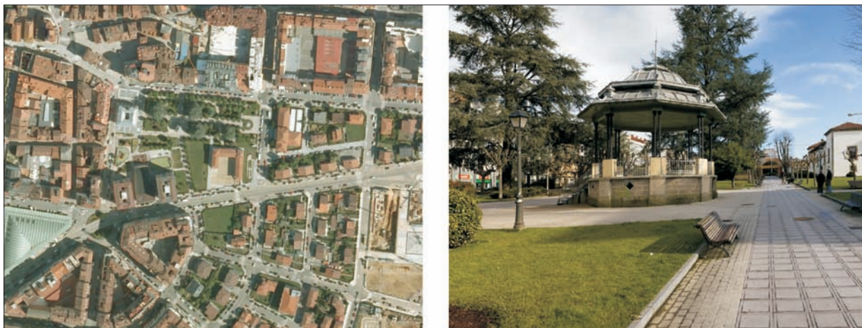
FIG. 14. Actuando de gozne entre el casco antiguo de la villa de Pola de Siero y su ensanche oriental, la casa consistorial y el espacioso Parque de Alfonso X el Sabio, marcan una zona esponjada dentro de la actual trama urbana. La forma rectangular del parque queda alterada por la expansión hacia el sur de una mancha arbolada, que contribuye a dar más sosiego al centro urbano poleso. Plátanos y árboles autóctonos asturianos espesan las áreas de sombra alrededor del templete de la música, elemento central de este espacio verde. Escala aproximada 1:5.700.

levante en materia de jardinería. Nos referimos a los macroproyectos de finalidad educativa, recreativa, e incluso algunas factorías industriales cuyo carácter modélico o demostrativo implicaba una urbanización esmerada. A la cabeza entre los ejemplos más sobresalientes figuran sin duda la Universidad Laboral gijonesa y la Ciudad Residencial de Perlorá, con vergeles que especialmente en el primer caso ya son calificados como históricos. Otras instalaciones como la Feria de Muestras de Gijón, algunas piscinas o campos hípicas, lucen jardinillos y planos de césped. La antigua ENSIDESA es una de las fábricas provistas de espacios verdes, por ejemplo con función de pantalla, relativamente extensos aunque casi por completo carentes de tratamiento decorativo, en las inmediaciones de los edificios no productivos y las vías de comunicación.