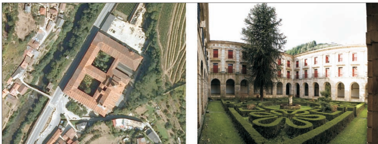
FIG. 1. En primer término, vista aérea del Monasterio de Corias, monumental edificio iniciado en 1022 por los condes Pipiolo y Aldonza, cedido dos décadas más tarde a los monjes benedictinos, los cuales cubrieron en sus alrededores la mayor mancha de viñedos de Asturias. Tras varios incendios a lo largo de su extensa historia, su factura actual es debida al maestro Ferro Caaveiro en 1774, guardando una estética herreriana que le asemeja a El Escorial. La otra imagen muestra uno de los dos patios o claustros, en el que aún se mantiene la técnica de la topiaria versallesca, con el boj podado en hermosas formas geométricas; en el centro del cuadrado se sitúa un pozo, más funcional que plástico, y en un lado, se levanta el primer ejemplar de araucaria traído a Asturias en el siglo XVIII, ya con un porte extraordinario. El edificio será abierto en breve como parador nacional. Escala aproximada 1:3.400.

(Barcelona). Las formas del verde urbano o periurbano también se vienen modificando rotundamente con la irrupción de la ciudad difusa, que incrementa la componente natural a base de jardines privados, pero también puede empobrecer o no tratar satisfactoriamente los espacios públicos (ZOIDO y otros, 2000).