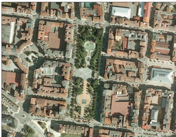
FIG. 20. En el centro de la retícula urbana de Mieres se encuentra situado el Parque Jovellanos, un rectángulo casi perfecto, equivalente a tres manzanas por los costados largos (calles Aller y Numa Guilhou) y un frente de manzana por los lados cortos (calles Carreño Miranda y Manuel Llana). El parque se levantó dentro del Ensanche de Mieres en 1920, y lo que hoy está ocupado por zona verde es solo una parte del proyecto original, que incluía un bulevar arbolado en dirección a las orillas, entonces sin canalizar, del río Caudal. Está articulado en dos sectores muy distintos por una plaza dura, que incluye un escenario de fábrica semicircular y con techo, para representaciones teatrales y musicales. Al norte se sitúa un lago con bastante vegetación arbórea en su derredor, mientras que el lado sur está más geometrizado y alquitranado para el paseo y el juego de niños. Dada su localización en la trama urbana mierense, y la cantidad de establecimientos de hostelería existentes en su entorno, es un lugar muy frecuentado por la población del lugar, que no dispone de otro parque de mayor entidad en la ciudad. Escala aproximada 1:5.250.