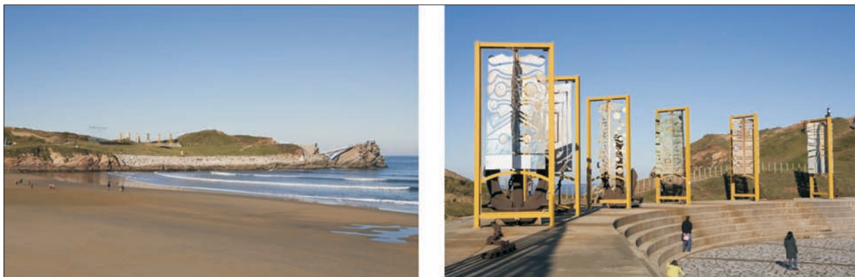
FIG. 22. Lo mismo que ha ocurrido con el realce de un espacio natural marítimo en el tómbolo o cerro de Santa Catalina en Gijón, con la gran escultura de Chillida (Elogio al Horizonte), en La Peñona, un promontorio rocoso situado al oeste de la playa de Salinas (Castrillón) se ha creado un museo al aire libre, como homenaje al mar y a sus gentes. Se denomina Museo de las Anclas Philippe Cousteau, al que está dedicado, y se ordena en varias piezas antrópicas distribuidas con mucho respeto sobre el medio litoral. El elemento central es un enorme busto en bronce de Cousteau sobre la Peña Lisa, un mural cerámico, una rosa de los vientos, un mirador sobre el mar, al final de un puente de bella factura, y un parque de velas y anclas en la plataforma superior de un graderío, con gran variedad cromática.

susceptibles de naturalización. Sumándoles lo que la ciudad obtiene con los nuevos accesos, rondas, vías de alta capacidad y cruces solventados mediante distribuidores como las rotondas, resultan distintas clases de espacios (márgenes, taludes, isletas, etc) fácilmente convertibles en pantallas, festones o pequeñas masas vegetales. Precisamente la política ambiental urbana evidencia un interés creciente en fomentar las clases más inferiores de áreas verdes, entre ellas las servidoras de vías rodadas. Su extraordinaria proliferación en Asturias, el empleo en ellas de criterios paisajistas y el consiguiente efecto de embellecimiento hacen que esos espacios ajardinados se sitúen entre los mejor percibidos por la ciudadanía.