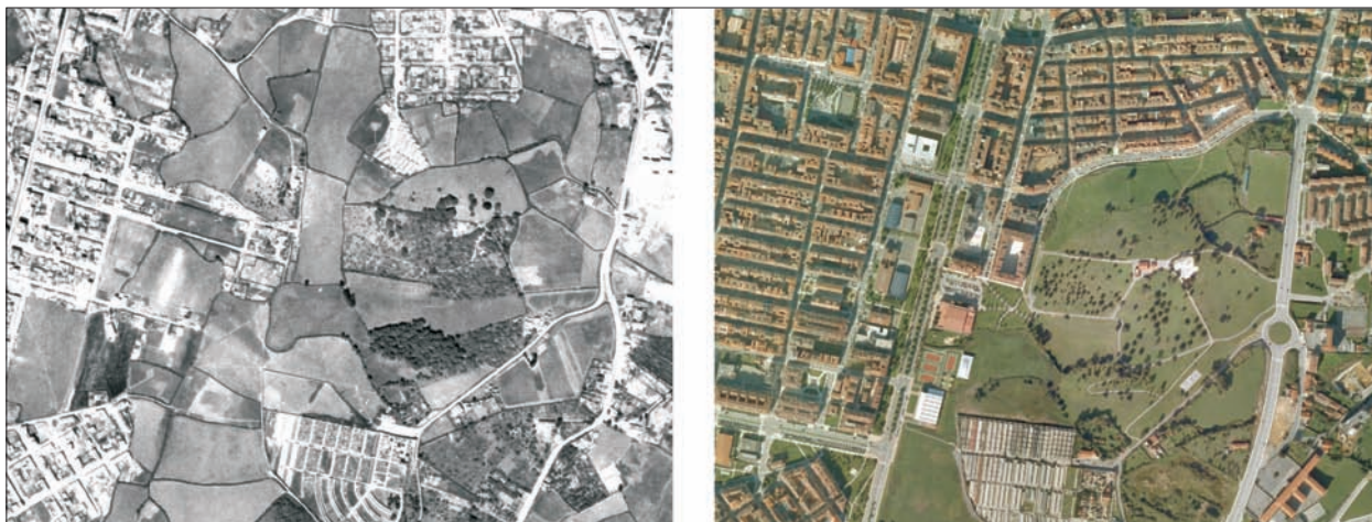
FIG. 18. El parque de Los Pericones está indisolublemente unido al Plan Especial de Reforma Interior de El Llano de la segunda mitad de los años ochenta, una de las mayores actuaciones urbanísticas desarrolladas en Asturias. La apertura de un gran vial al sur, entre el Paseo de Begoña y la actual autovía del Cantábrico, permitió ordenar una zona de infraviviendas, la típica de los bordes urbanos humildes, carente de un callejero bien alineado, infraestructuras, equipamientos, servicios y dotaciones. La gran parcela que ocupa actualmente el parque (14 hectáreas) es ligeramente alomada, y tiene como límites la amplia Avenida de El Llano, la antigua carretera minera y, al sur, el cementerio de El Sucu. Dada su juventud floral, el parque presenta solo una mancha verde, pero no tiene la estética de otros ya reseñados en este artículo. Próximamente será ampliado hacia el sur, hasta alcanzar más de 20 hectáreas, convirtiéndose así en el mayor espacio verde urbano asturiano. Escala aproximada 1:13.850.

central o de ciudad, es decir con área de influencia extensa aunque su tamaño no siempre sea importante. Es quizá el caso del parque del Cortijo (Grado), sobre un recinto abandonado del centro de la villa, o el parque de La Paz (también llamado de la Manzana Central) en Lugones, producto de la urbanización de suelo libre óptimamente situado junto a la vía central de ese núcleo, satélite de Oviedo.