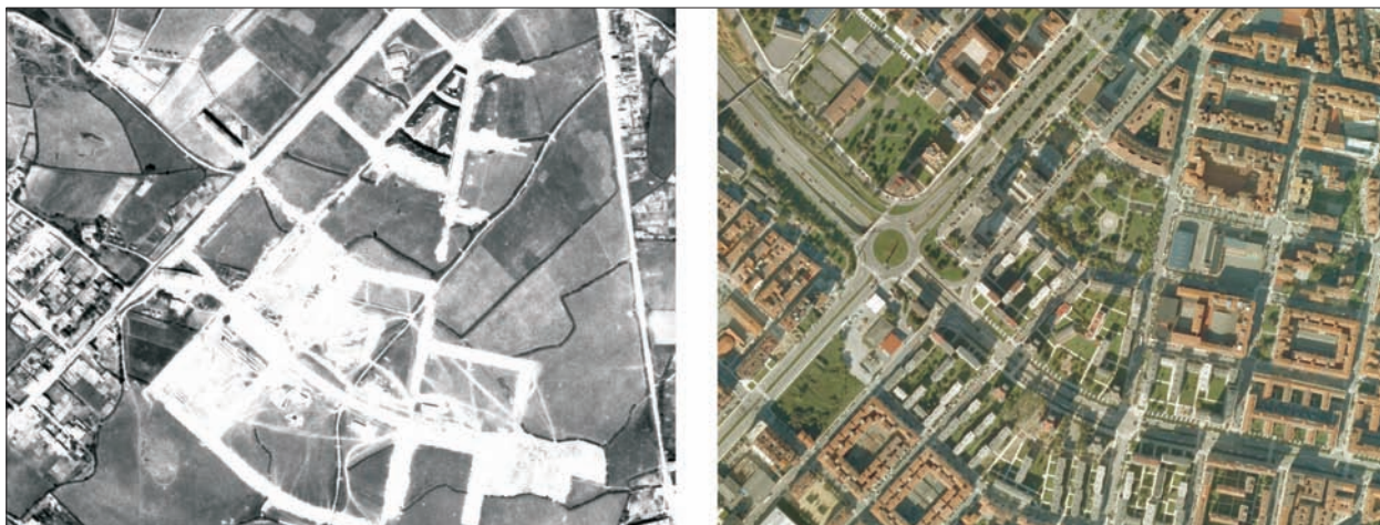
FIG. 16. A lo que en Avilés llamaban «poblados», en Gijón, y otras muchas partes de España, le llaman «polígonos» a las extensas áreas urbanizadas en la primera o segunda aureola de los cascos urbanos. En la imagen vemos el proceso de construcción del denominado «polígono de las Mil Quinientas», por el número de viviendas levantadas siguiendo los principios preconizados por el Open Planning , y la Carta de Atenas de 1942, imperantes en los años cincuenta en el urbanismo europeo occidental. Bloques abiertos a las cuatro fachadas, edificación en altura, zonas ajardinadas y de juegos entre casas, espacios libres, etc. Como ocurrió en muchos otros sitios, sobre todo en Canarias y Andalucía (Jinámar y las Tres Mil de Sevilla son buenos ejemplos), muchos de los espacios libres entre edificios fueron ocupados por las viviendas situadas en las plantas bajas para su ampliación, y al estar al cuidado de las comunidades de vecinos, la imagen de estos espacios verdes quedó menguada. Afortunadamente en este caso, cuando el ayuntamiento tomó a su cuidado la limpieza y conservación de estos espacios verdes, el polígono se ennobleció. Escala aproximada 1:10.400.