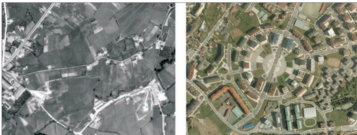
FIG. 23. Entre los grandes desarrollos urbanísticos tentaculares del nuevo Oviedo, tanto en su sector occidental como oriental, los estándares urbanísticos al uso obligan a proveer una parte sustantiva de espacios verdes. En estas fotos de años distintos se aprecia la transformación de rural a urbano de una zona dedicada preferentemente a viviendas protegidas o de precio tasado, distribuidas en bloques de poca altura, entre los que se intercalan un mosaico de espacios verdes. La Corredoria Este, tal como se denomina a este sector recientemente urbanizado, a pesar de su cuidado urbanístico, no puede eludir la fuerte segregación social que se da en conjunto del tejido urbano ovetense, con una almendra central con viviendas muy caras, y las dos franjas laterales, que acogen a la población de menos recursos económicos. Escala aproximada 1:9.200.

res (El Espartal, Salinas, 16 has. con plantación de especies autóctonas), formas costeras interesantes (Cabo San Lorenzo, Gijón, 14 has.) o relieves que separan los valles del interior: el cordal de Urbiés en el Turón, dentro de los paisajes protegidos de las cuencas mineras.