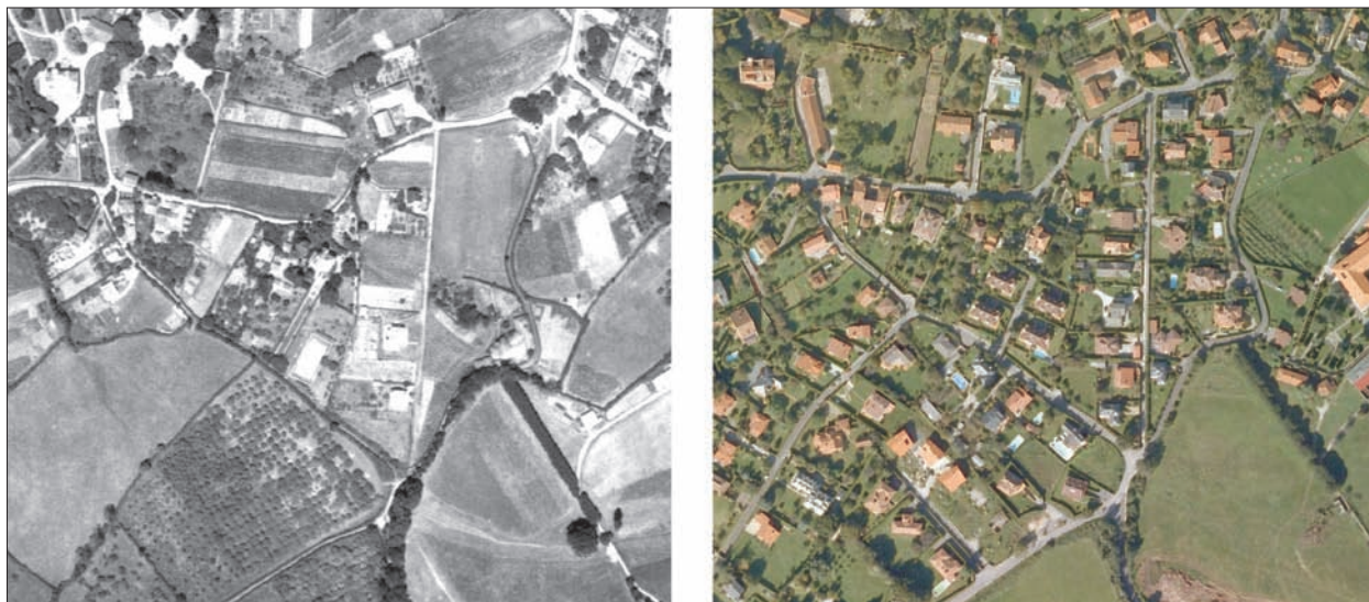
FIG. 7. El ideario de «villa rústica», concebida como quinta de veraneo, o segunda residencia en los alrededores de las ciudades marítimas como Avilés (Salinas) y Gijón (Somió), está muy bien representado en las imágenes correspondientes a dos períodos bien distintos, separados solo por unas cuatro décadas. En la primera foto aérea se aprecia la inserción discreta de las quintas en el parcelario rústico de Somió, mientras que en la segunda, la presión inmobiliaria y la emulación de muchos nuevos hacendados por poseer una villa en las afueras del Gijón noble y clorófilo, se ha reflejado en la excesiva parcelación tradicional para alojar a estos conjuntos, cada vez con parcelas más pequeñas, de casa y jardín. Escala aproximada 1:6.100.

atesora algunas construcciones de esa naturaleza en la calle Galiana y el Ensanche de Palacio Valdés.