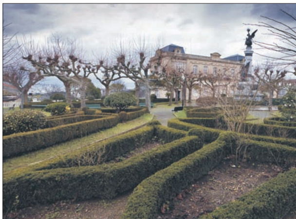
FIG. 12. Mirando hacia la ría del Eo, y en el promontorio ocupado por el pequeño núcleo urbano de Castropol, encontramos una pequeña plaza ajardinada, probablemente de principios del siglo XX, a tenor del marcado carácter modernista de sus elementos arquitectónicos más relevantes; así, la inmediatez del Casino/Casa de la Cultura, el trazado mismo del parque y, sobre todo, el magnífico monumento al marino Villamil, atestiguan que estamos ante una obra trazada en la segunda década del siglo XX, sobre el antiguo Campo de Tablado, lugar de reunión en concejo. En un pueblo en el que tan bien trabajan las coloridas alfombras de flores, la estampa que vemos es un tanto asceta, con una topiaria muy elemental y con los omnipresentes plátanos. Al fondo de la imagen, en un costado de este parque, llamado Vicente Lorient, se encuentra el palacio barroco del Marqués de Santa Cruz, que próximamente se convertirá en un lujoso hotel.

asentamientos resultantes de aquella política oficial de vivienda están muy claramente diferenciados dentro de las ciudades actuales, e incluso en algunos núcleos mineros donde el crecimiento se interrumpió a partir de los años setenta todavía representan una porción sustancial del espacio urbano. Los modelos aplicados por la Administración y por las empresas fueron evolucionando, desde la ciudad-jardín hasta el open planning, con sus correspondientes sistemas de espacios libres y elementos clorofílicos. En un principio las colonias de Casas Baratas primorriveristas o republicanas se convierten en colonias de Casas Económicas o chalés, con pequeños huertos o mini jardines. Fozaneldi o Guillén Lafuerza en Oviedo responden a ese patrón, así como Santa Bárbara en Tremañes (Gijón) y el pequeño barrio de Blancanieves situado en Pola de Laviana. Aunque predominen, los destinatarios no son necesariamente grupos con rentas bajas, puede tratarse de técnicos o ingenieros como los de la empresa Cristalería Española que ocupan la colonia de La Maruca (Avilés). Parte de las iniciativas fueron obra de promotores privados, que recurrieron a la protección oficial para construir Casas Económicas o de