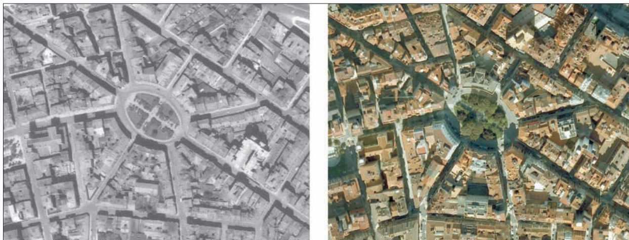
FIG. 3. Visión diacrónica de la plaza ovalada de Evaristo San Miguel, también llamada La Plazuela. Situada en uno de los extremos de la ciudad intramuros del Gijón antiguo, es el nexo de unión con el Ensanche y, por tanto, a pesar de su reducida extensión, es uno de los parques más frecuentados por los gijoneses. Abrigada entre altos edificios, es también centro del camino que une dos de los ámbitos más frecuentados por los paseantes: el muro de la playa de San Lorenzo y el Paseo de Begoña. A los socorridos plátanos ( Acer platanoides ) de casi todos los pequeños parques asturianos o castellanos, a la plazuela se le ha añadido una flora exótica, que le da un aire excesivamente boscoso para sus exiguas dimensiones. Escala aproximada 1:4.850.

número de aquellos «campos» subsisten, incluso con sus denominaciones originales, en forma de plazas actuales. La del Carbayedo en Avilés, el Campo de los Patos y el de Santullano en Oviedo, el Campo Valdés de Gijón, albergan aún hoy jardines más o menos fieles al esquema primigenio de arboleda y prado, propio de recintos que se utilizaban tanto para solaz (romerías, fiestas) como para celebración de ferias y mercados: incluso como lugar de pasto comunitario, en el ovetense Campo de los Reyes del que no resta sino el topónimo. En cuanto al Campo Valdés, su origen se situaría, según Granda, en el Renacimiento, pero los arreglos propios de un jardín sólo parece poseerlos desde el siglo de las Luces. En la Asturias rural, el núcleo de La Plaza de Teverga parece tener origen en la explanada existente frente a la colegiata de San Pedro, obedeciendo por tanto al modelo espacial que nos ocupa.