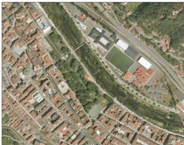
FIG. 9. En un fondo de valle en el que las minas de hulla, las industrias siderúrgicas y los espacios residenciales para alojar a tanta población, ocupaban la mayor parte del suelo existente, la construcción de un parque necesario, y de una superficie significativa (tres hectáreas), no podía ser en otro lugar que a la vera del río Nalón. Es así como surge el Parque Dorado, situado en Sama, y el mayor del concejo de Langreo. Robándole parte del lecho fluvial, la estructura formal no podía ser otra que la lineal, y con abundante arbolado caducifolio. Iniciado en 1905, ha ido creciendo a medida que han sido mayores los requerimientos de espacios libres en una zona bastante densa de edificación. Su trazado es muy elemental, y su diseño bastante sencillo, sin pretensiones. Escala aproximada 1:8.500.

Los procesos expansivos de las ciudades se apoyaron igualmente en un nuevo modelo residencial, la colonia ciudad-jardín, aplicada en sentido social descendente. Las clases medias o medias altas construyeron sus hotelitos ajardinados (versión menor del palacete u hotel particular) en las parcelaciones que iban colonizando los terrenos de mejores condiciones ambientales, caso del Prado Picón (colonia Montealegre) y La Matorra (carretera de Los Monumentos) en Oviedo. Las Leyes de Casas Baratas, desde 1911 a los años veinte, democratizaron relativamente ese producto al hacerlo asequible a empleados y más raramente obreros. Queda una muestra reducida de las colonias de Casas Baratas e iniciativas emparentables debidas al paternalismo industrial, que interesan al objeto aquí tratado en la medida en que cada alojamiento incluía un microjardín o huerto, si no las dos cosas. Gijón conserva las Casas del Coto y Oviedo las colonias Ladreda (Otero) y Marqués de San Feliz (Adelantado de La Florida), Siero tiene los barrios denominados Jerusalén y Las Casas Baratas. En