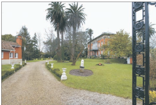
FIG. 8. En la imagen (villa María, Somió) aparece una villa o quinta de las más prístinas, con finca cercada, casa principal y la del casero y un jardín inglés, con plantas exóticas, muy similar a los levantados en las casas de indianos.

venciones, que en casos como Oviedo darían lugar a plazas desprovistas de verde. La excepción fue Gijón, que en plena Guerra Civil puso en marcha la reforma o apertura de varios espacios públicos (plazas del Instituto, Náutico, Italia), cuyo ajardinamiento ya es obra posbélica, si bien han sido ulteriormente remodelados.