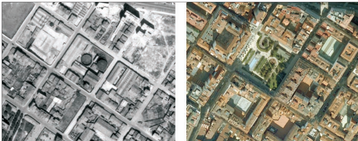
FIG. 21. En un solar cuadrangular dejado por la fábrica de gas de Gijón, en un costado de la calle Ezcurdia, y muy cerca de la parte central de la playa de San Lorenzo, en el barrio de El Arenal, se levantó hace menos de dos décadas un parque, que recibe el nombre de Fábrica del Gas, vendido al ayuntamiento por su propietaria, Hidroeléctrica del Cantábrico. El parque, rodeado de edificios de nueva factura en su mayoría, dada su juventud, tiene un aparcamiento subterráneo que apenas afectará a la vegetación que crezca en su losa superior; tiene rosaledas, parque infantil, además de una fuente y estanque de reducidas dimensiones. Escala aproximada 1:4.450.

parciales y polígonos, cuyas áreas verdes son más trascendentes en términos espaciales y tienen una afección más estrictamente urbana que algunos de los tipos anteriores. El análisis comparado de los paisajes habitacionales de última generación revela que son muy desiguales en calidad, pero en general aportan cambios cualitativos considerables, sin ir más lejos en cuanto al enriquecimiento de la morfología. Continúan utilizándose las mallas ortogonales pero superando la rigidez racionalista, de manera que los conjuntos se organizan a partir de bulevares centrales interrumpidos rítmicamente por glorietas (La Florida, Oviedo). Frente al anterior dominio del open planning ahora cabe la manzana semiabierta o cerrada con espacios libres privados, para cubrir el suelo proporcionado por la planta regular. Pero también se recurre a composiciones más imaginativas, por ejemplo radioconcéntricas a partir de una plaza central (La Corredoria Este, Oviedo), o bien un tipo mixto con calles en arco o fragmentos contrastados.